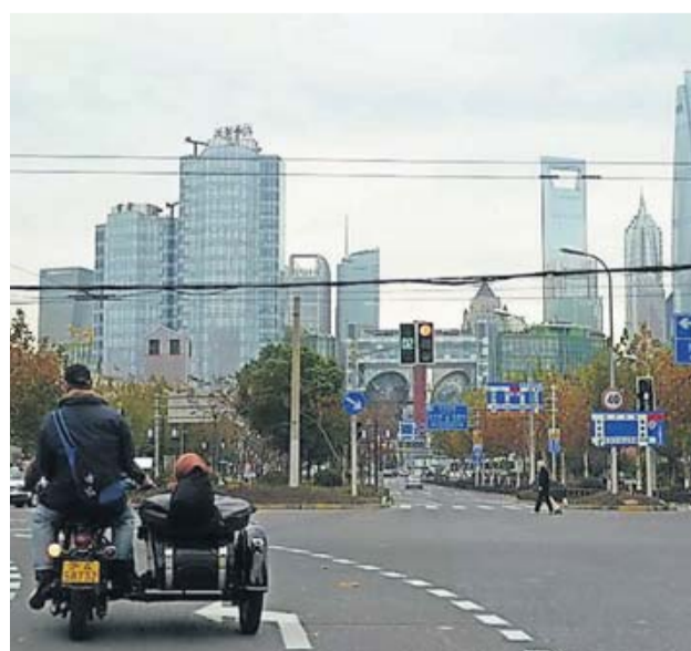
Im Motorrad-Beiwagen durch die Stadt: Ein besonderes Erlebnis.

Die Autorin reiste mit Unterstützung von Shangri-La und China Tours.