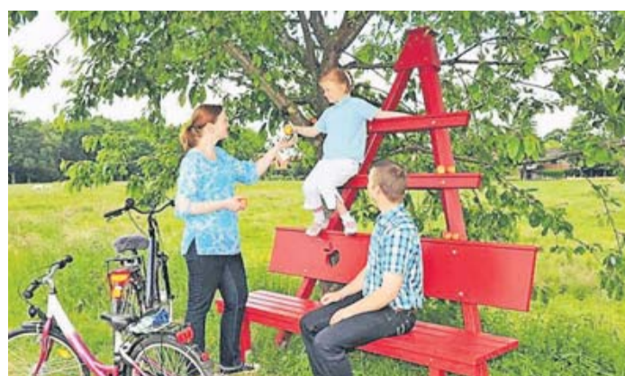
Mundräuber-Bänke laden zum Obstnaschen ein.

Dabei laden die ausgebauten Radwege entlang der Hase zu Nasch-Pausen an den zahlreichen Obstbäumen ein. Entlang dieser Obstbaum-Alleen führt die Route von Melle über Osna-brück durch das Artland und das Emsland bis nach Meppen. Unübersehbar sind die roten Mundräuber-Bänke, die eine gemütliche Rast und ein leichtes Erklimmen der Obstbaumkronen ermöglichen. Abends, nach einer ereignisreichen Etappe, wartet ein ausgewähltes gastfreundliches Quartier auf die Radler. Ob