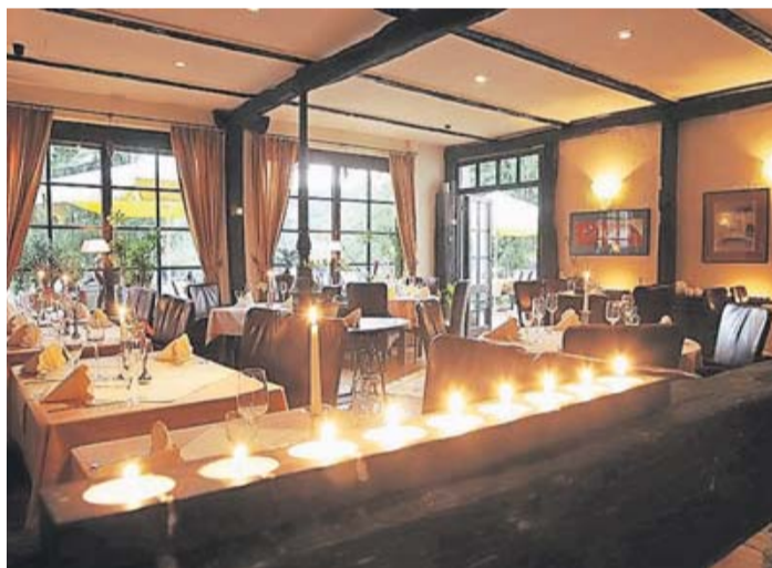
Das gemütliche Drei-Sterne-Hotel Lahnromantik.