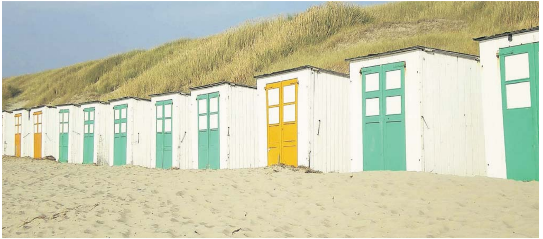
Breiter Strand aus feinem Sand, bunte Holzhütten und grasbewachsene Dünen, hinter denen sich Naturschutzgebiete und Wanderpfade erstrecken – Texel ist Naturgenuss pur.

Der Reiseveranstalter Marco Polo hat neue Rundreisen für junge Leute durch Singapur, Malaysia und Thailand im Angebot. Zum Beispiel die 17-tägige Rundreise „Singapur-Malaysia-Thailand – Island Hopping in Fernost“. Dabei hüpfen junge Reisende nicht nur von Insel zu Insel, sondern auch von einer Metropole zur nächsten. In Georgetown auf der malaysischen Insel Penang warten hingegen feurig-würzige Überraschungen auf die 20- bis 35-jährigen Gäste: die Streetfood-Leckereien in der historischen Altstadt gehören zu den besten Asiens. Informationen gibt es bei der Mitreisebörse auf der Young Line Travel Website: Red www.marco-polo-reisen.com/youngline