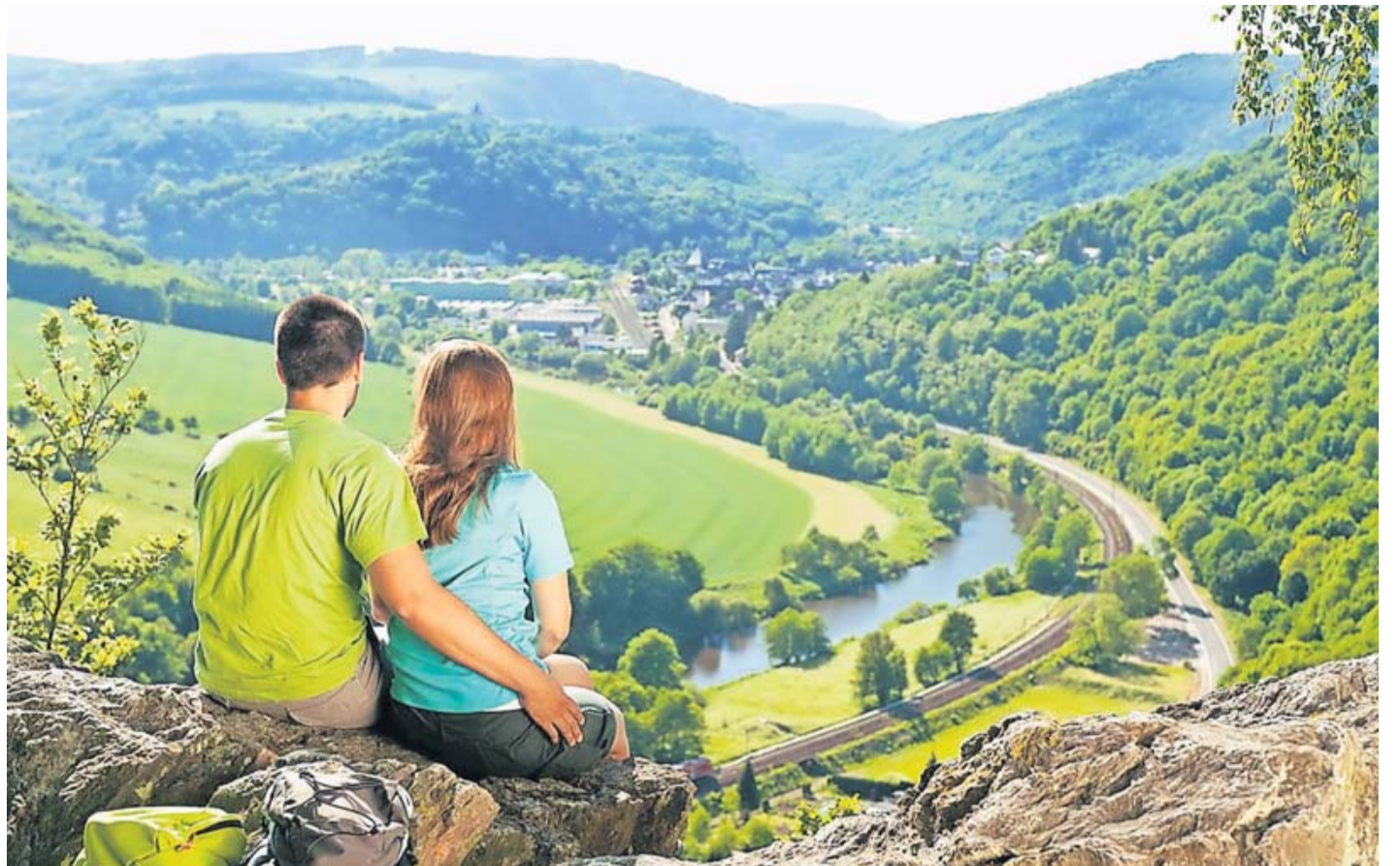
Der Lahnwanderweg bietet imposante Ausblicke über die hügelige Flusslandschaft.

Besonders der Lahnwanderweg eignet sich gut zum Wandern von einem Standort aus, weil die Orte am Weg fast alle einen Bahnhof haben und man so am Ende der Tour problemlos zum Ausgangspunkt zurückfahren kann. Es gibt viele Möglichkeiten, die Flusslandschaft Lahn zu entdecken: als Wanderer auf dem Lahnwanderweg, mit dem Rad über den Lahntalradweg, per Boot auf dem Wasser oder mit der Bahn auf der Lahntalstrecke.