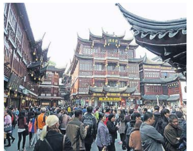
In der Altstadt ist immer viel los.

Unschlagbar günstig ist der „Fake Market“. Wer