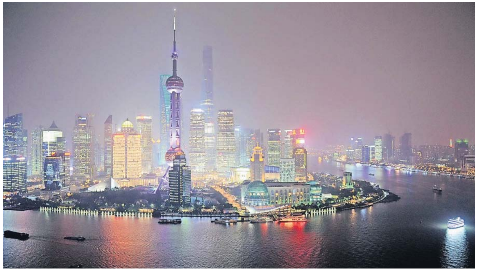
Bei Nacht ist sie besonders beeindruckend: Die Skyline der Millionenstadt Shanghai glitzert und leuchtet in der Dunkelheit.

POST Otto-Hausmann-Ring 185, 42115 Wuppertal TELEFON 0202/717-2542 FAX 0202/717-2660 MAIL reise@wz.de